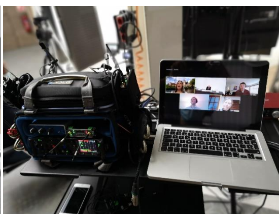
Imatge de la jornada prèvia al congrés