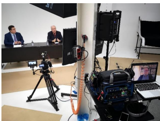
Imatge del congrés

Al dia abans vam organitzar el Pre Congress Day amb la participació de científics internacionals de gran prestigi, així com de revistes científiques d'alt nivell.