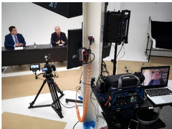
Imagen del congreso

Al día antes organizamos el Pre Congress Day con la participación de científicos internacionales de gran prestigio, así como de revistas científicas de alto nivel.