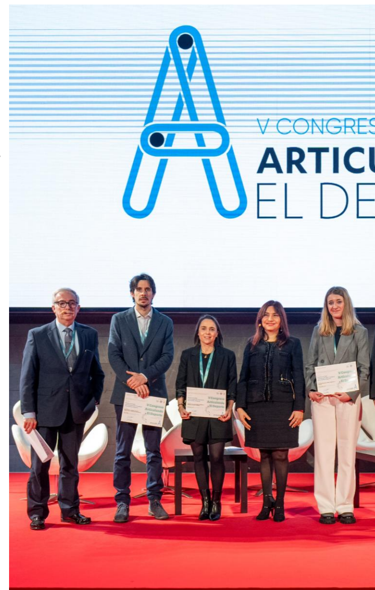
Defensa pósters en #ARTICULANDO25

Coffee break con el apoyo de Leche Pascual