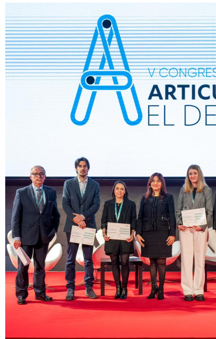
Defensa pósters en #ARTICULANDO25