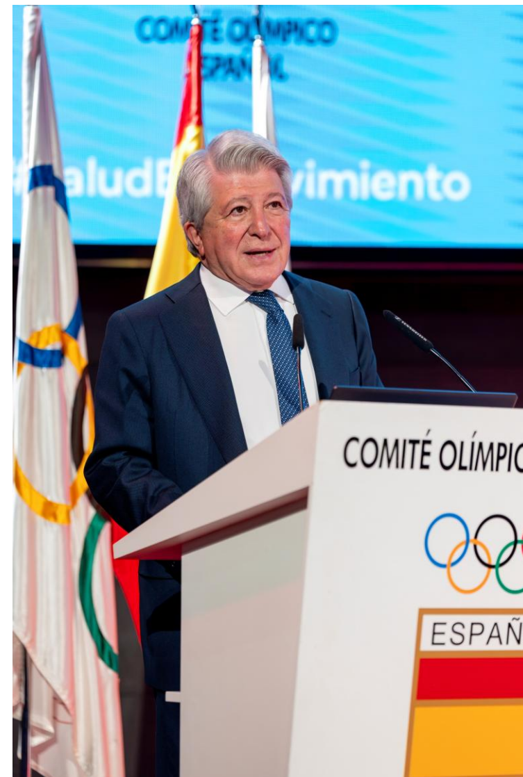
Enrique Cerezo, Presidente del Atlético de Madrid